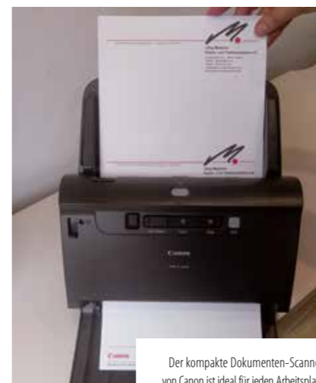
Der kompakte Dokumenten-Scanner von Canon ist ideal für jeden Arbeitsplatz

In der Branche ist die Anzahl der Maschinen im Feld (MiF-Bestand), über die