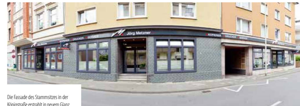
Die Fassade des Stammsitzes in der Königstraße erstrahlt in neuem Glanz